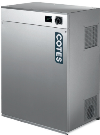
C35 PÁRÁTLANÍTÓ (PLC vezérléssel)