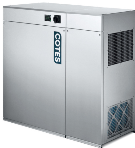
C35 PÁRÁTLANÍTÓ HŐVISSZÍNÉRŐ EGYSÉGGEL