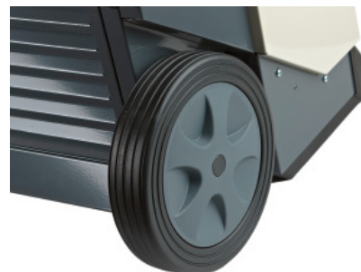
Nagy méretű gumi kerekek segítségével könnyen és biztonságosan lehet mozgatni a készüléket.

Az összes Dantherm CDT szárítóberendezés a hűtveszáritás elvén működik. A ventilátor beszívja a szárítandó levegőt a készülékbe, ahol a kompresszoros hűtőkör harmatponti hőmérséklet alá hűti azt. A lehülés során a levegő nedvességtartalma kicsapódik és elfolyik a tartályba. Ezt követően a hűtőkör kondenzátor egysége felmelegíti a levegőt és az visszajut a szárítandó térbe.