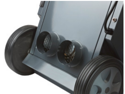
CDT 30 S és CDT 40 S gépek 1 kW-os elektromos fűtőbetéttel, nagyteljesítményű ventilátorokkal és légszűrőkkel vannak ellátva a 2 db Ø100mm méretű, 5 m hosszú flexibilis légszűrőcsatornához.

A CDT berendezésekhez a vízgyűjtő tartály helyére építhető kondenzvíz szivattyú opcionális kiegészítő, melynek segítségével a termelt kondenzátumot közvetlenül a csatornába lehet vezetni. Így a készülék akár folyamatosan is üzemelhet és nem kell a tartály kiöntésére időt fordítani.