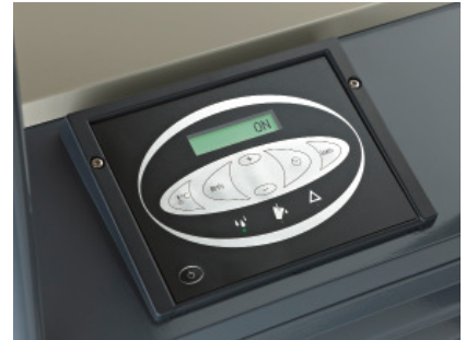
Digitális kijelző, beépített páratartalom érzékelő, fogyasztásmérő, karbantartás ciklus jelző, diagnosztika.